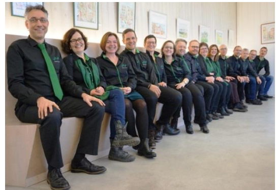
Das JCP-Team neu in Grün-Schwarz, als Team einheitlich aufeinander abgestimmt.

Das Job Coach Placement hat sich entschieden, sich neu einzukleiden. Ziel war, das bisherige Konzept für einen einheitlichen Firmenauftritt zu überarbeiten: Mit der neuen Corporate Fashion soll das CI-Corporate Identity an Anlässen, Schulungen oder Firmenpräsentationen verstärkt nach aussen getragen werden.