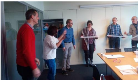
Zusammenspiel im Team ist gefragt

Lassen wir uns aufeinander ein und profitieren von der Verschiedenheit und von den vielen Ressourcen! Das Zitat von Franz Kafka bringt es auf den Punkt: „Alles Reden ist sinnlos, wenn das Vertrauen fehlt.“