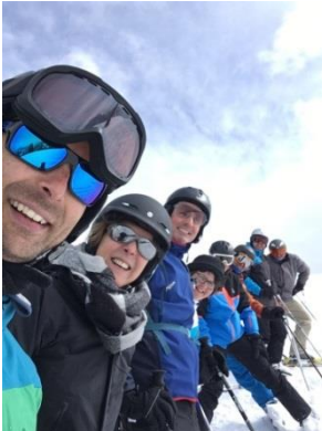
Skifahren als Team

Als ein Team ab in den Schnee! Am Morgen des 7. März starten wir mit Kaffee und Gipfeli im Hotel Kernen