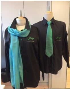
Nähproben mit Krawatte und Foulard

Das Job Coach Placement hat sich entschieden, sich neu einzukleiden. Ziel war, das bisherige Konzept für einen einheitlichen Firmenauftritt zu überarbeiten: Mit der neuen Corporate Fashion soll das CI-Corporate Identity an Anlässen, Schulungen oder Firmenpräsentationen verstärkt nach aussen getragen werden.