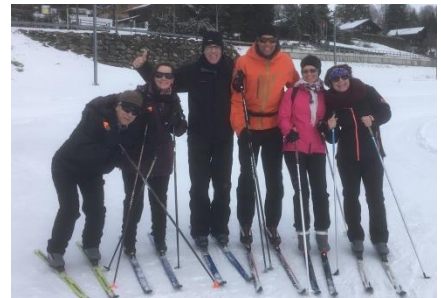
Die Langlauf-Gruppe mit Lehrer

im herrlichen Schönried. Später heisst es für einige ab auf die Bretter und hoch mit der Bergbahn. Die Pistenverhältnisse sind super, die Stimmung auch. Für eine zweite Gruppe unseres Teams geht es weiter auf den Langlauf-Latten. Nach einer kurzen Einführung durch einen erfahrenen Langlauflehrer wird eifrig ausprobiert und durch die verschneite Gegend gekurvt. Am Mittag treffen wir uns hungrig beim feinsten Fondue und einem Gläschen Wein im extra reservierten Kuhstall. An so einem Tag, weit weg von der alltäglichen Arbeit in einer entspannten Atmosphäre, wird viel gescherzt und gelacht, was uns als Team zusammenschweisst. Am nächsten Morgen spürt doch der eine oder die andere den Muskelkater von der ungewohnten „Arbeit“.