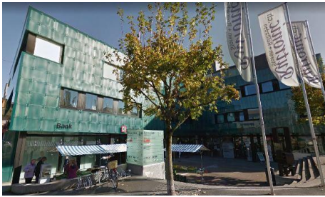
Seestrasse 30 in Spiez

Bereits seit zwei Jahren bauen wir unser Angebot örtlich für das Berner Oberland aus. Deshalb, haben wir neu einen Standort mit Büro in Spiez in den Lokalitäten der Kinder- und Jugendpsychiatrie (KJP) der UPD. Dies ist sicher sehr positiv für die Zusammenarbeit mit der KJP, auf der anderen Seite sind wir für Klienten, IV und Sozialdienste aus dem Berner Oberland vor Ort ansprechbar. Sie erreichen uns im Berner Oberland über Tel. 033 826 23 80.